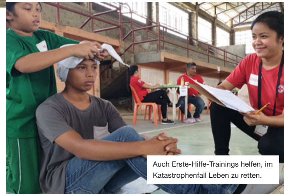
Auch Erste-Hilfe-Trainings helfen, im Katastrophenfall Leben zu retten.

Gewalttätige Konflikte zwingen auf der philippinischen Insel Mindanao Hunderttausende zur Flucht. Wiederkehrende Wirbelstürme setzen den Vertriebenen zusätzlich schwer zu. Das Rote Kreuz steht den Betroffenen bei.