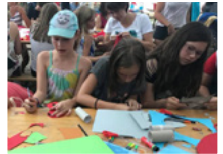
Eifrig basteln sich die Kinder Kostüme für das Mottofest.

Und werden aus manchen Teilnehmern tatsächlich die Rotkreuzler von morgen? „Unbedingt“, nickt Stefan Gehrke. „Schauen Sie sich unser Organisationsteam an!“