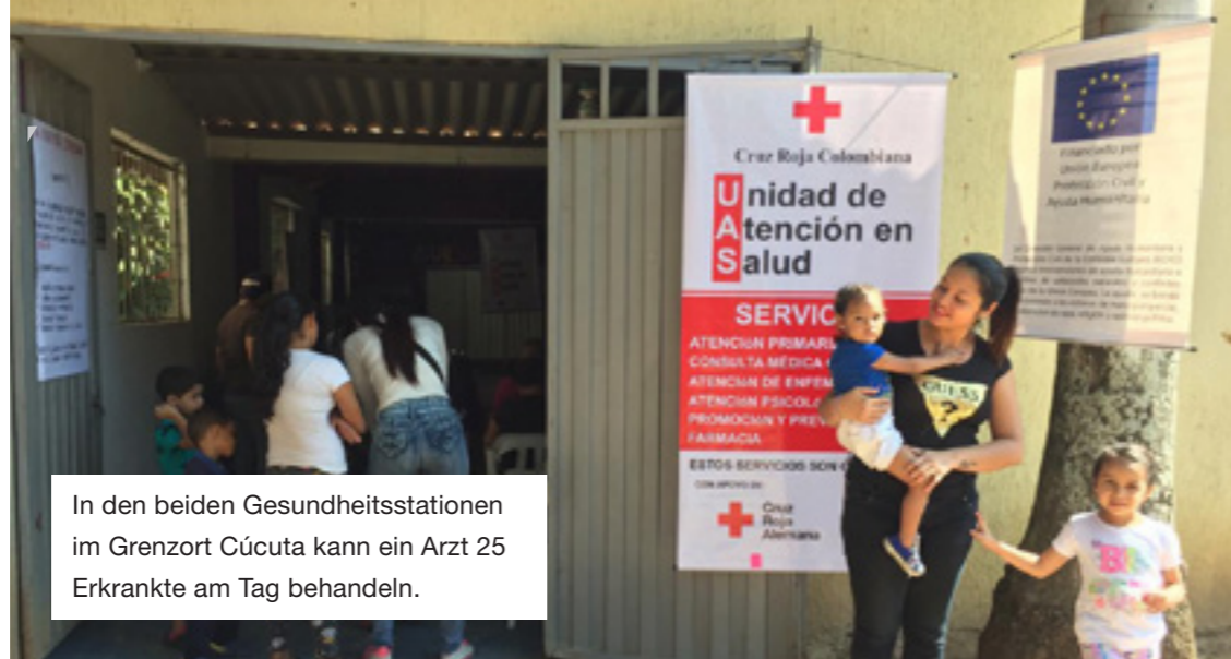
In den beiden Gesundheitsstationen im Grenzort Cúcuta kann ein Arzt 25 Erkrankte am Tag behandeln.